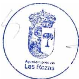
Fdo. José de la Uz Pardos Alcalde del Ayuntamiento de Las Rozas